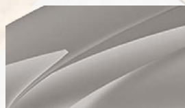
Beige Cappuccino (4K4K)