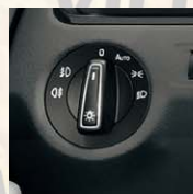
Allumage automatique des phares.