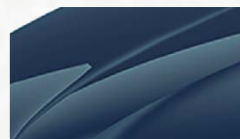
Bleu Pacifique (Z5Z5)