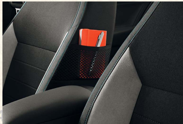
Sellerie spécifique tissu/Alcantara, tapis de sol avant et arrière, petit pack cuir. Insert décoratif "Noir brossé" sur tableau de bord.