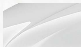
Blanc Cristal (9P9P)