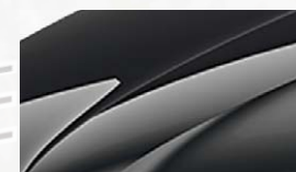
Noir Magic Nacré (1Z1Z)