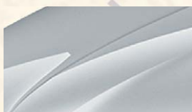
Gris Argent (8E8E)