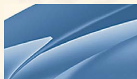
Bleu Denim (G0G0)