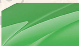
Vert Rallye (P7P7)