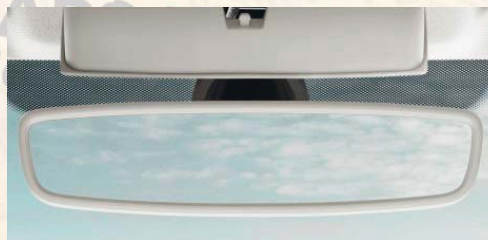
Rétroviseur intérieur électrochromique et détecteur de pluie.