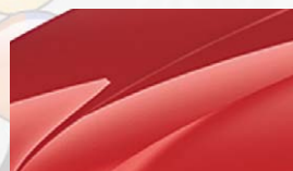
Rouge Corrida (8T8T)