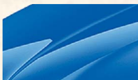
Bleu Racing (8X8X)