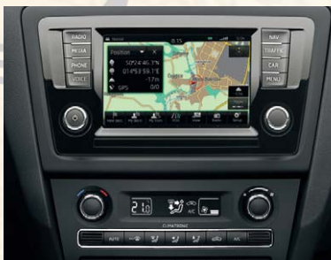
Système de navigation GPS "Amundsen" et climatisation automatique Climatronic®.