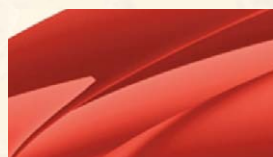
Rouge Rio (6X6X)