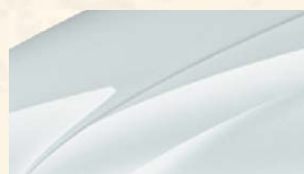
Blanc Lune (ZY2Y)