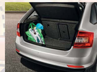
Coffre à bagages avec crochets d'attache.