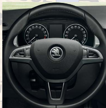
Volant cuir multifonctions radio / téléphone.