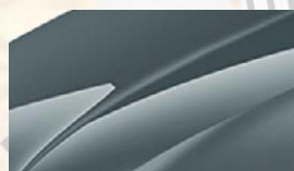
Gris Météore (F6F6)