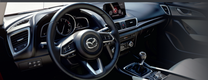
Mazda3 Sélection avec option cuir « Pure White » (2)